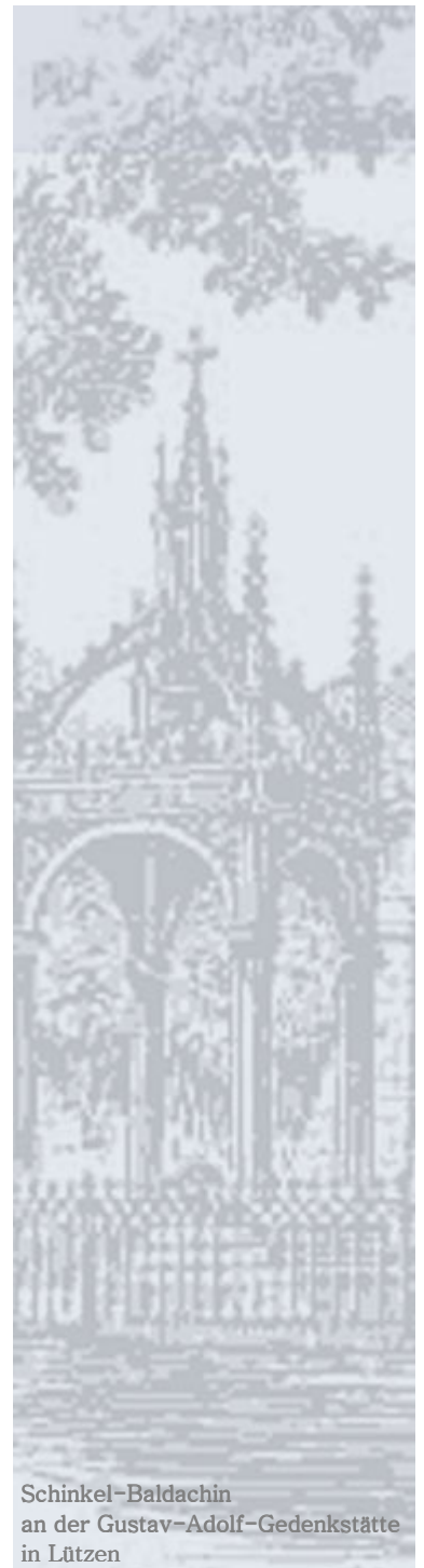
Schinkel-Baldachin an der Gustav-Adolf-Gedenkstätte in Lützen