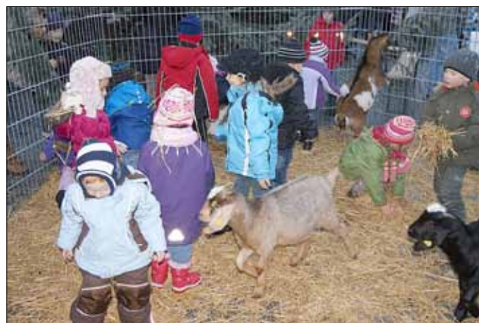
Streichelzoo auf dem Marktplatz

Der 3. Lützener Glühweinmarkt war wieder einmal ein voller Erfolg. Nach der Eröffnung durch die Feuerwehr, dem Bürgermeister sowie den teilnehmenden Vereinen und Kindergärten startete das weihnachtliche Programm.