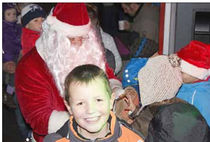
Der Weihnachtsmann ist da!

An den Ständen der Kitas gab es weihnachtliche Basteleien, die schön anzusehen waren und auch gern gekauft wurden. Zum ersten Mal auf unserem Glühweinmarkt konnten die Kinder Tiere vom Lützener Martschpark in einem Streichelzoo erleben.