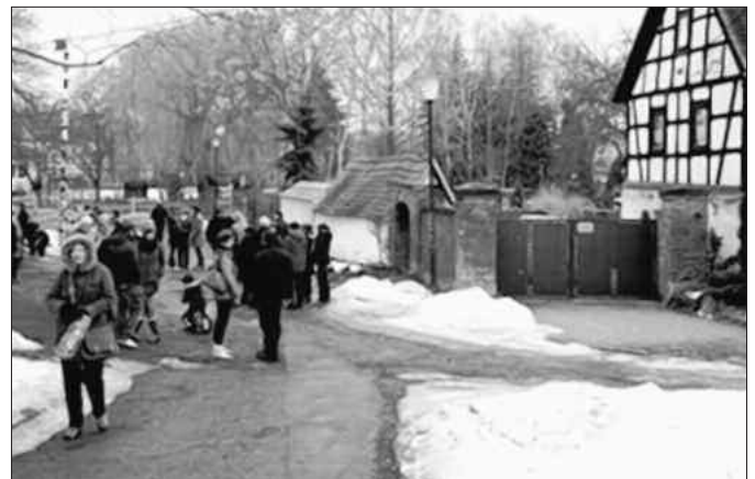
Treffpunkt Wetterfahne in Muschwitz, am Anger